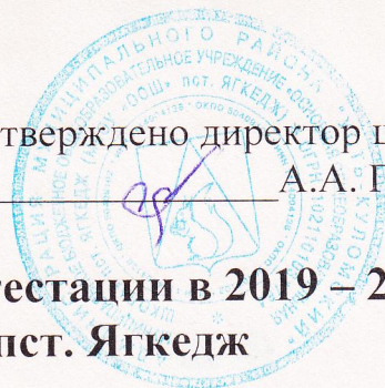
График проведения промежуточной аттестации в 2019 – 2020 учебном году МБОУ «ООШ» пст. Ягкедж